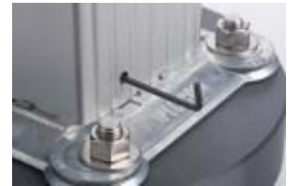
Clé hexagonale de 3.97 mm utilisée pour verrouiller / déverrouiller le socle

Seulement la section avec les vis à six pans creux visibles glisse vers le haut et vers le bas en vue de l'installation et l'entretien du socle. NE PAS UTILISER D'OUTILS ÉLECTRIQUES POUR VERROUILLER OU DÉVERROUILLER. Une clé hexagonale de 0.39 cm (non inclus) est utilisée pour verrouiller ou déverrouiller l'enceinte. Tourner les vis autant que possible DANS LE SENS DES AIGUILLES D'UNE MONTRE pour déverrouiller le socle et DANS LE SENS INVERSE DES AIGUILLES D'UNE MONTRE pour verrouiller. L'utilisation d'outils électriques sur ces vis les abîmera et elles ne peuvent pas être remplacées sur place !