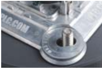
Anneaux de montage en place

-4 connecteurs de fils (8 par les modèles DR).